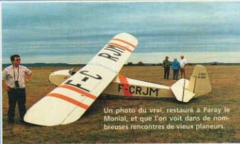
Un photo du vrai, restauré à Paray le Monial, et que l'on voit dans de nombreuses rencontres de vieux planeurs.

La fixation des ailes est assurée par deux clés d'âles plates en acier 20/10 fixées dans l'aile sur des âmes en bois dur entre les deux lon-