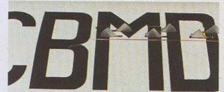
Les A.F. du C311 P.